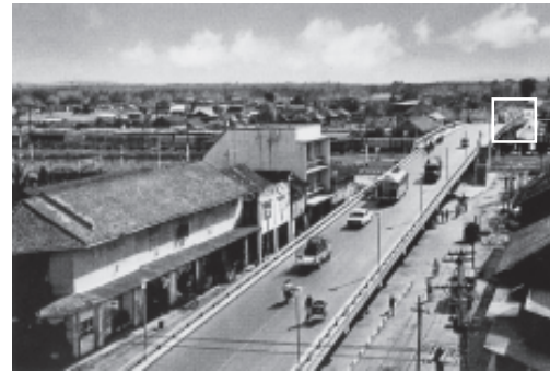
ห้องสมุดประชาชนหาดใหญ่

การสมัครเป็นสมาชิกห้องสมุดประชาชนง่ายกว่าที่คิด แล้วทันใดนั้นผมก็ กลายเป็นขาประจำของสถานที่แห่งนี้ ขอยืมหนังสืออ่านเล่นกลับบ้านสม่ำเสมอ ถลาตัวเข้าไปในโลกแห่งความฝันลึกลงทุกที